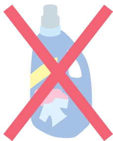
洗剤、シャンプー、 リンスなどの容器