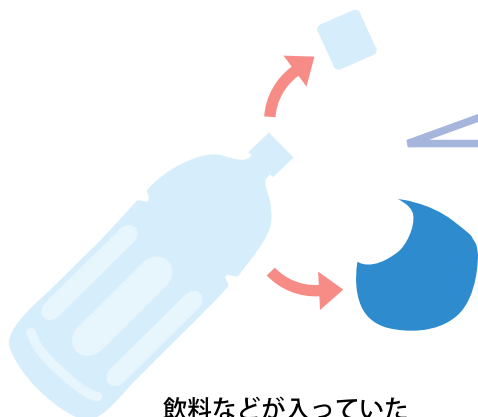
飲料などが入っていた ペットボトル