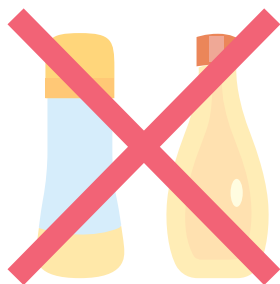
たれ、ソース、ドレッシング、 食用油などの容器