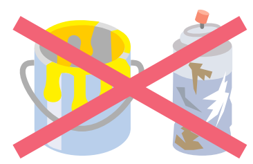
さびた缶、汚れた缶