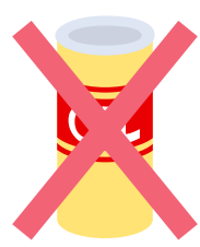
サラダオイルの缶