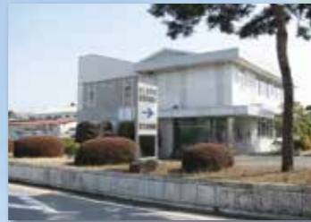
さしま環境管理事務組合 管理事務所

さしま環境管理事務組合では、構成市町からの可燃ごみや資源ごみ、ごみ焼却後の焼却灰等を関係法令を遵守した適切な処理管理を行います。リサイクルプラザ（不燃ごみ・資源ごみ・粗大ごみ処理施設）では粗大ごみを細かく破碎する破碎機カッター刃交換工事、最終処分場では汚泥脱水機の更新工事等を行います。