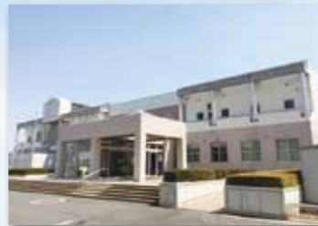
猿島コミュニティセンター