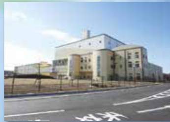
さしまクリーンセンター寺久 熱回収施設 リサイクルプラザ