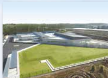
さしま健康交流センター 遊楽里