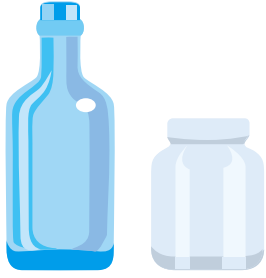
飲み物・食べ物が入っていたビン