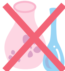
ガラス製の灰皿や 花瓶などの調度品