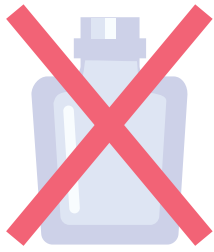
化粧品や薬品のビン (飲み薬以外)